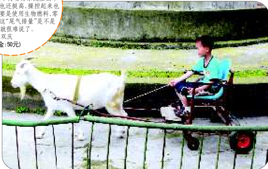
羊把式 地点:湖北省宜昌市儿童公园内 作者自述:这车的动力系统应该不差,安全系数也还挺高,操控起来也还简单,最重要是使用生物燃料,零油耗。不过,这“尾气排量”是不是严重超标,就很难说了。 作者:胡双庆 (奖金:50元)