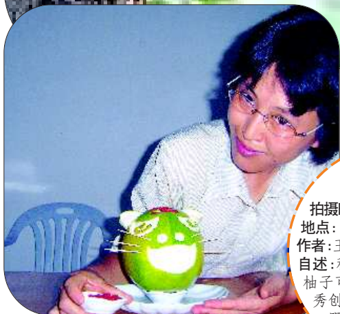
“柚子虎”! 拍摄时间:2010年9月20日 地点:自家客厅 作者:王闯九 自述:秋天正是柚子热卖季节。柚子可吃,可玩,不妨拿柚子秀创意,“养生”之前先“养眼”。 (奖金:50元)