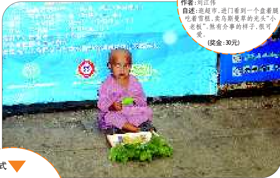
小老板 拍摄时间:10月1日 地点:新疆乌鲁木齐家乐福超市大巴扎店外 自述:逛超市,进门看到一个盘着腿吃着雪糕,卖乌斯曼草的光头“小老板”。煞有介事的样子,很可爱。 (奖金:30元)