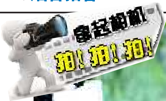
绝对“靠谱儿” 拍摄时间:2010年10月13日 (奖金:50元)