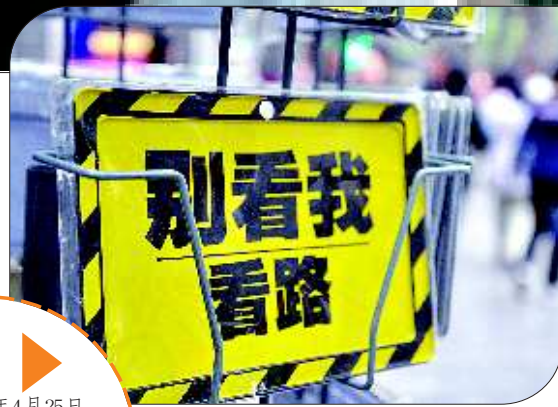
“看路”路呢? 拍摄时间:2010年4月25日 地点:西安回民街 自述:回民街的一家小店里,摆出一个特色的指示牌。 作者:张波 (奖金:30元)