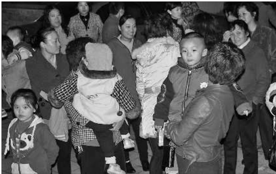
▲不少居民抱着孩子观看事态进展。