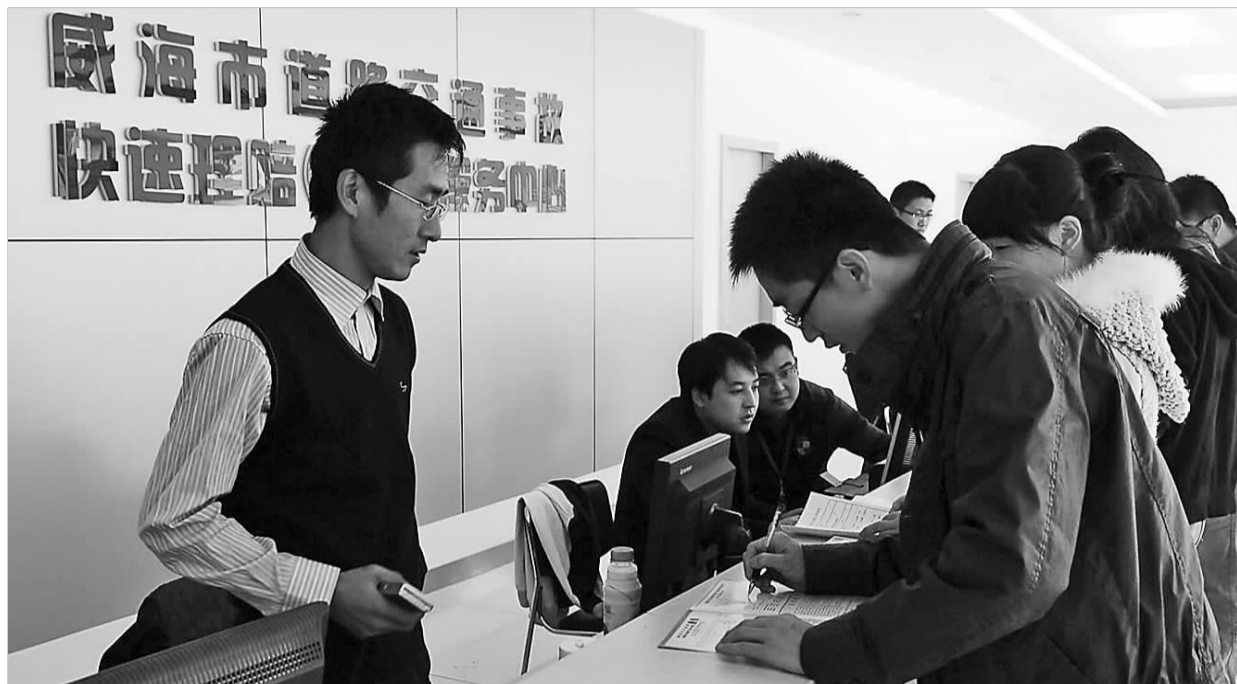
在这个位于威海市文化西路275—2号的快速理赔服务中心,当事人可以“进一个门,办所有事”。

快速理赔(威达)服务中心还设立了独立的评估机构,一旦车主对财产损失评估有争议,可直接到此进行评估,不必再往返奔波。