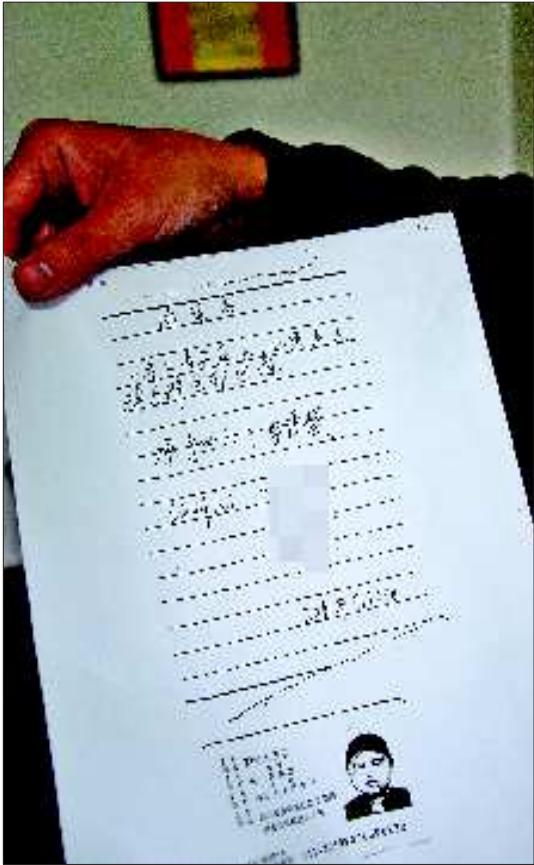
媒人李秀英给曹女士家签下的“协意(议)书”。

至于媒人李秀英与鲁阿甲的行为是不是诈骗,需要具体分析。如果他们当初登记结婚的目的是缔结婚姻而按照民间风俗收取数万元的彩礼,后来又对婚姻不满意离家出走,这种行为不是以非法获得钱财为目的,不构成诈骗。如果媒人与鲁阿甲等妇女当初根本没打算结婚生活,而打着结婚的幌子,将钱骗到手、达到目的后就不见踪影,这种行为的主观目的是骗取钱财,应当以诈骗罪追究刑事责任。