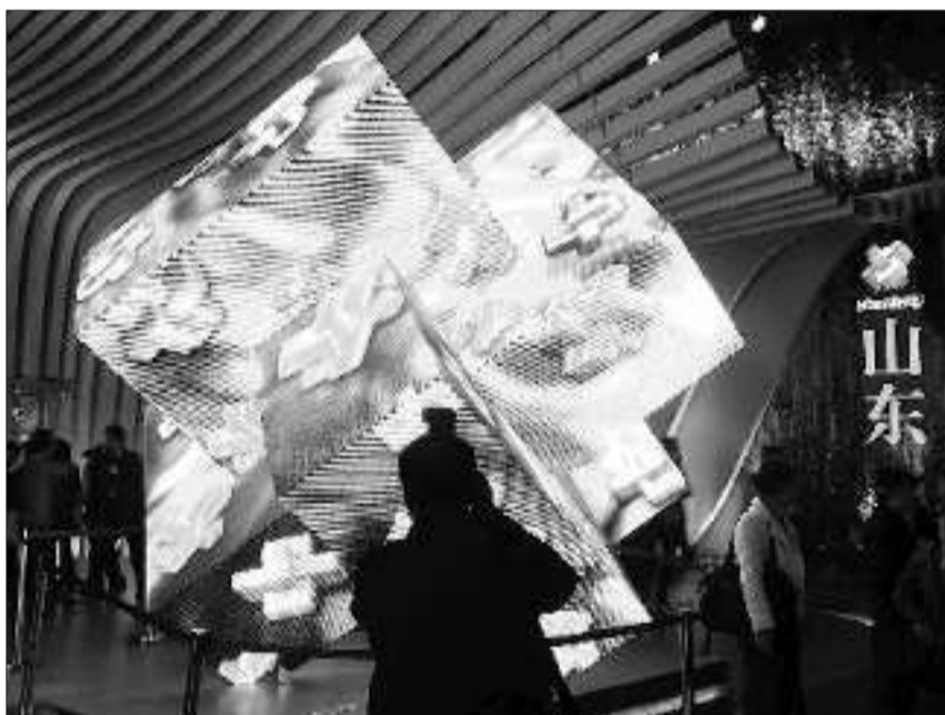
世博山东馆入口处的巨型鲁班锁由2100多块LED管束模块组控而成,仅拆除就需要10天的时间。

2010年世博会将于本月底闭幕,除一轴四馆(世博轴、中国国家馆、世博会主题馆、世博中心和世博会演艺中心)永久保留外,包括山东馆在内的临时展馆都将拆除。山东馆在设计上是可循环搭建使用的场馆,上海世博会结束后将实施保护性撤展。山东馆将如何回“家”?本报记者前往上海世博会山东馆进行了深入采访。