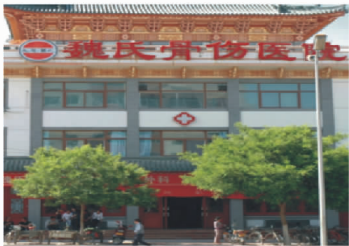
↑位于甘肃天水的魏氏骨伤医院