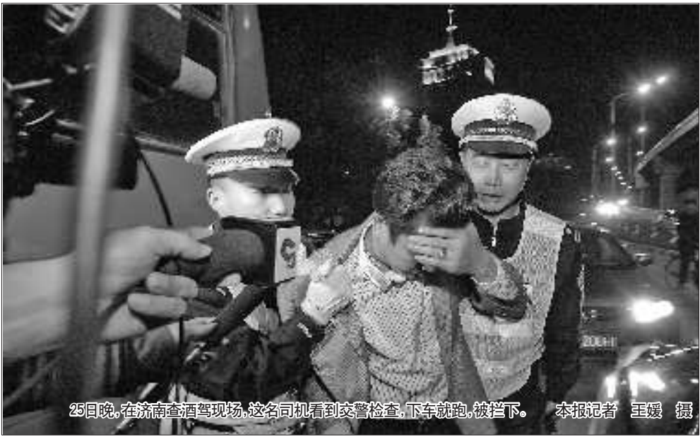
25日晚,在济南查酒驾现场,这名司机看到交警检查,下车就跑,被拦下。

本报济南10月26日讯(记者 董钊 杜洪雷 实习生 张其) 10月25日晚,济南市交警部门在市区范围内开展了查处酒驾的集中行动。25日下午,济南公安微博曾经公布此事,但当晚仍查处了44起酒后驾驶和10起醉酒驾驶。 25日下午4时许,济南公安微博发布信息称,济南交警将于晚上集中严查“酒驾”。其间,网友戏称:“公安‘泄密’了。”“如果能够教育,挽救那些抱有侥幸心理的违法违章人员,减少和预防此类违法违章行为的发生,这种秘密我们愿意经常泄露。”济南公安回复道。 25日晚,记者随交警来到了位于经四路高架桥下桥口的检查点。晚8点45分,一辆黑色轿车正从主干道自北向南行驶,本不需要经过检查点,但车主发现执勤交警后突然停车,这引起了几位交警的注意。交警正准备上前检查,谁知这辆车竟在车流中加速向后倒车。后面都是在主干道上高速行驶的汽车,情况十分危险。几位交警立即冲上前拦下了这辆轿车,谁知该车刚被拦下车主便打开车门冲了出来,掉头就跑。一位交警当即上前将他控制住。 “为什么看见我们就跑!”交警问道。这位车主开始并不说话,后来坦白:“我喝了点酒,只有一瓶而已,没事儿。我酒量差,酒量差……”面对交警要求进行的酒精测试,他显得十分紧张。 最后,他的酒精测试结果显示为0.15,酒精数值在0.09到0.39之间属于酒后驾驶。 在接下来的检查中,竟然有一辆白色小轿车试图冲卡,几位交警强行将这辆车控制住。车主从车上下来后闭口不言,出示驾驶证时也不说话,对酒精测试仪吹了多次气都显示“吹气不足”,明显心里有鬼。这位车主的测试结果为0.40,属于醉酒驾驶,他将面临拘留15日的处罚。 25日夜间,济南交警查处酒后驾驶44起,醉酒驾驶10起,当日行政拘留无证和醉酒驾驶人员25人。