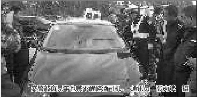
交警敲窗晃车也喊不醒醉酒司机。

本报泰安10月26日讯 (记者 孔红星 通讯员 张力斌 李洪健)10月25日下午,一名酒司机在开车回家的路上,在车上睡着了。轿车停在路口,导致道路堵车长达一公里。泰安特警、民警、消防官兵等在现场敲窗户晃车身长达一个多小时,驾驶员竟然没有感觉出来。 25日下午3时30分左右,泰城市民王先生开车经过老泰莱路时,发现前方排起了长长的队伍,很长时间都挪动不了几米。后来才得知在老泰莱路与泰佛路交叉路口有一位司机睡着了,交警喊都喊不醒。 泰安交警直属一大队开发区中队民警介绍,下午3点多,他们赶到现场后,发现该车停在路中间,驾驶员睡在车内,东西道路堵