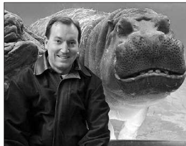
帕克拍照时,河马在旁露“微笑”。

60年前,一名没有公开身份的私人收藏家买下这颗钻戒,一直保存至今。