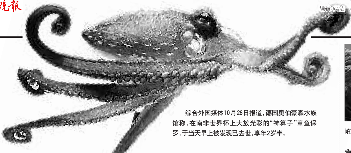
综合外国媒体10月26日报道,德国奥伯豪森水族馆称,在南非世界杯上大放光彩的“神算子”章鱼保罗,于当天早上被发现已去世,享年2岁半。