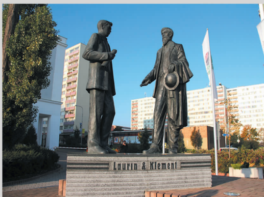
劳林和商人柯雷门特，开启了一个百年品牌的发展旅程 斯柯达的两位创始人——机械师

说来有些汗颜，在此次行程前，鼹鼠和足球，便是本人对于捷克这个国家的全部印象了。直到我置身于布拉格——这座仿佛凝固于历史尘烟中的千年古城之后，才逐渐了解到它深邃的历史和辉煌的文化。数百年间，源于此处的诗人、哲学家、音乐家、作家层出不穷，如国人所熟知的卡夫卡、米兰·昆德拉，以及“遗传学之父”孟德尔，均为捷克人；而贝多芬、莫扎特、李斯特、肖邦等音乐大师的生活和创作，都与号称“欧洲之心”的捷克有着深厚的渊源。更令人意外的是，深究讲究情调的小资一族追捧的“波希米亚风格”，其正宗的出处正是在捷克的西部。悠久的历史、绚烂的文化、智慧的头脑以及发达的工业文明，孕育出了一个拥有百年发展史的汽车品牌，那便是我们此行的主角——斯柯达。 文/片 韩爽