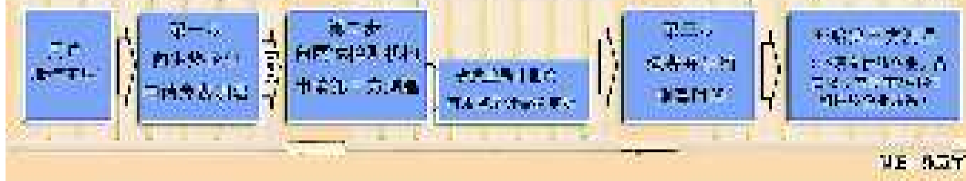
2009—2010采暖季,省城首次引入了第三方测温。在济南市市政公用事业局公布的检测操作细节中,用户实施第三方检测的程序如上图。