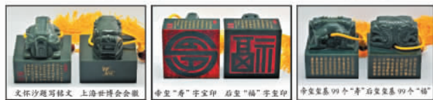
文怀沙题写铭文 上海世博会会徽 帝玺“寿”字宝印 后玺“福”字宝印 帝玺玺基99个“寿”后玺玺基99个“福”