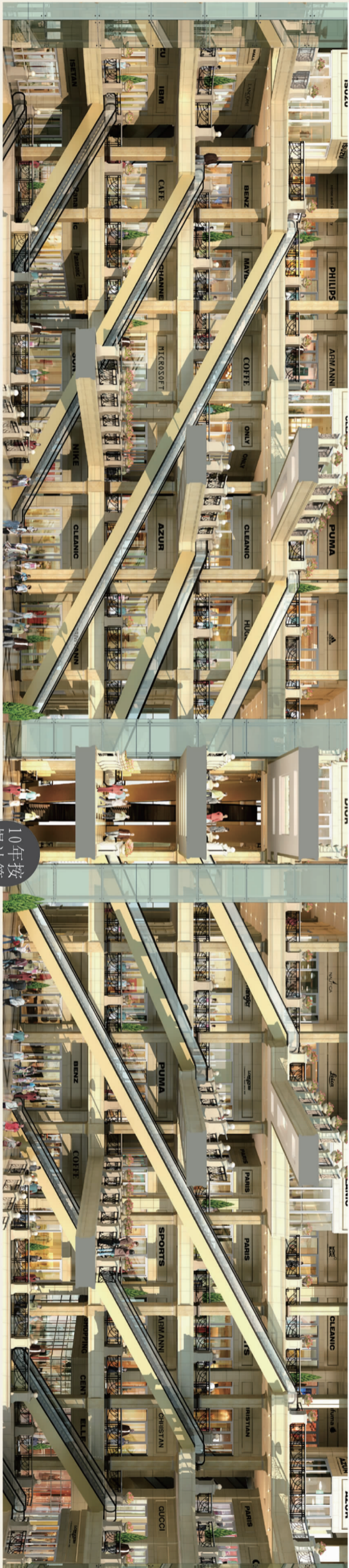
10年按揭计算 本资料所涉及的所有内容及图片仅供参考，均不作为商品房买卖合同条款，最终以政府文件及商品房买卖合同约定为准。最终解释权归山东诚基地产开发有限公司所有。齐建开预字第(2010)289号 装修效果图