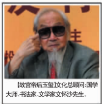
【故宫帝后玉玺】文化总顾问：国学大师、书法家、文学家文怀沙先生。