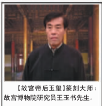
【故宫帝后玉玺】篆刻大师：故宫博物院研究员王玉书先生。