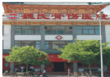
↑位于甘肃天水的魏氏骨伤医院