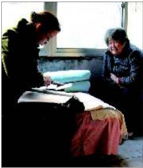
普查员在东花园社区普查登记

全国第六次人口普查的入户登记工已经正式展开,最累、最苦的要数走街串巷的普查员,很多普查员为了完成普查任务,家属齐上阵,帮忙完成普查工作。2日下午,记者深入社区了解了普查员的酸甜苦辣。