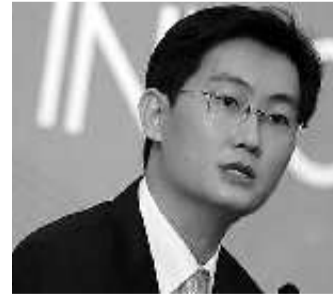
腾讯公司董事会主席马化腾