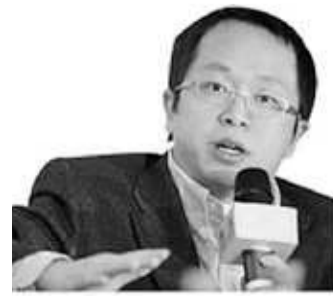
360安全中心董事长周鸿祎