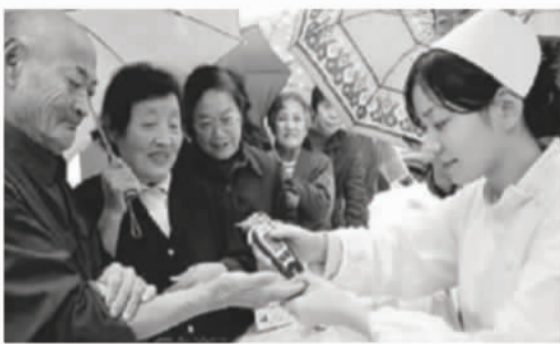
首批断药患者在化糖门诊检测血糖

临床报告显示：化糖疗法可对多种并发症同时治疗，使用期间可科学减少口服药，降低药源性并发症几率；二是在使用期间，糖尿病人用药量减少，降低了药物之间