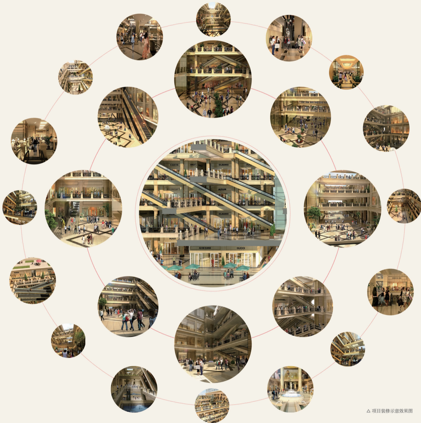
△项目装修示意效果图

成熟商圈, 独立产权, 一站式商业步行街 一期商业100%售罄, 86%的出租率, 已售商铺出租价格平均4.5元/m²/天, 购房成本回收期限约11.8年, 年均回报率接近8.47%, 租金月收入直逼应付按揭款, 且成上升趋势, 商业街已然成势!