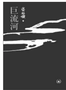
《巨流河》 齐邦媛 著 生活·读书·新知三联书店