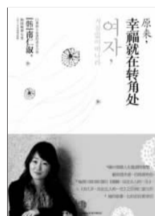
《原来,幸福就在转角处》 [韩]南仁淑 著 中信出版社

以物质为幸福的人们,最终都和幸福擦肩而过,他们不知道,幸福其实并不遥远,也很简单,就在一回头,就在转角处。真正困难的,是他们还没有学会回头,没有学会转身。