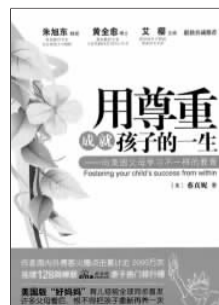
《用尊重成就孩子的一生》 [美]蔡真妮 著 漓江出版社

有人曾经质疑美国对孩子的尊重是否会疏于管教,其实这是两回事。美国父母对孩子的行为和礼貌的要求非常严格,认为这也是尊重的教育,是要学会尊重他人。