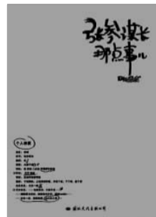
《张参谋长那点儿事》 四处撸撸 著 国际文化出版公司

小说《张参谋长那点儿事》讲述了“张参谋长”的青春成长过程中,一路与亲情、友情、爱情相伴走来的故事。