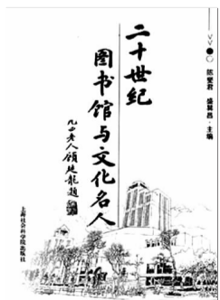
《二十世纪图书馆与文化名人》 陈燮君 盛昊昌 主编 上海社会科学院出版社