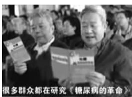
很多群众都在研究《糖尿病的革命》

某报曾报道过关于“化糖疗法”进驻济南的消息, 据调查, 确实有一本关于“化糖”的医学书籍, 而且是由中医古籍出版社出版的, 在新华书店要卖 28 元。该书提到这样一个观点: 糖尿病并不是血糖高的病, 一旦恢复了人体的化糖本能, 即使 80 岁的糖尿病也能彻底康复。