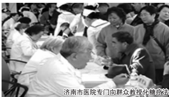
济南市医院专门向群众教授化糖疗法

版的新书《化糖, 糖尿病的革命》中这样写道: “化糖本能是人体自身就具备的, 不是任何人给你的, 任何口服药都给不了你化糖的本能。”