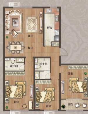
三室两厅两卫 | 面积约148m 2