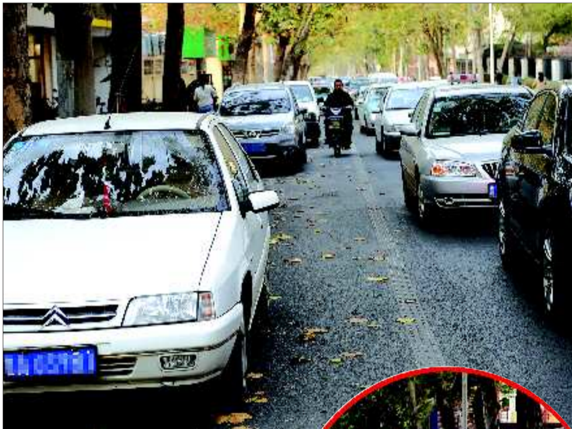
闵子骞路上,许多机动车停在本来就不宽的道路边,造成交通拥堵不堪。

市民不解:改造后的闵子骞路为何没彻底解决人车混行和拥堵问题 市政部门:大部分费用花在地下管网建设上了