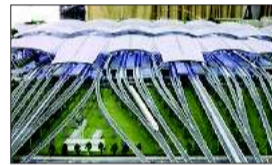
广州新火车站效果图。