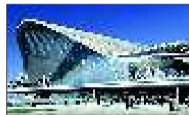
武汉新火车站效果图。