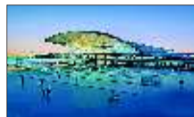
大连新火车站效果图。