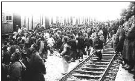
1903年4月通往青州的铁路开通。

水宜生·除氯宝 每人仅限1台 抢购专线:0536-8275678 8866399