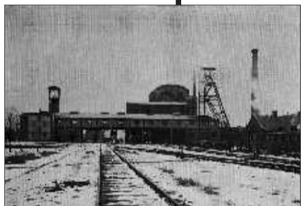
上世纪三十年代日本占领时期的坊子煤矿

19世纪中叶前,坊子并不存在。1898年3月6日,德国人凭借《胶澳租界条约》攫取了胶济铁路的修筑权和沿线15公里以内矿藏的开发权,煤资源丰富的坊子从此落入德国人的控制之下。德国人在“前后张路院”和“南北宁家沟”之间寻找合适的开采点,因附近有一小铺名为“坊子”,德建车站便以坊子冠名。