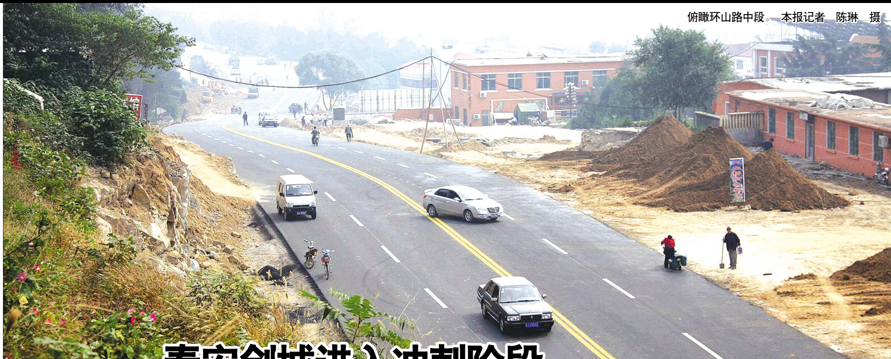
俯瞰环山路中段。