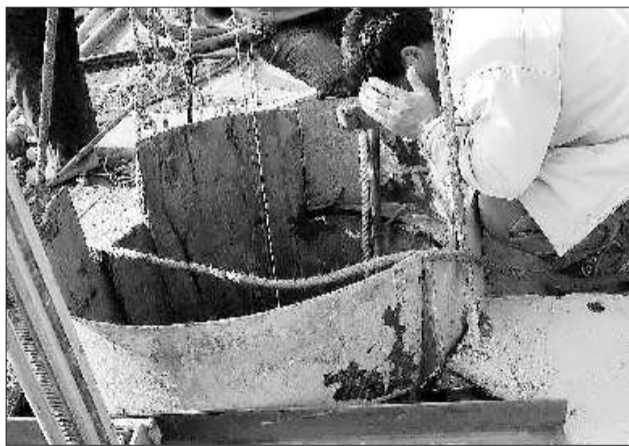
听声，听“生”。