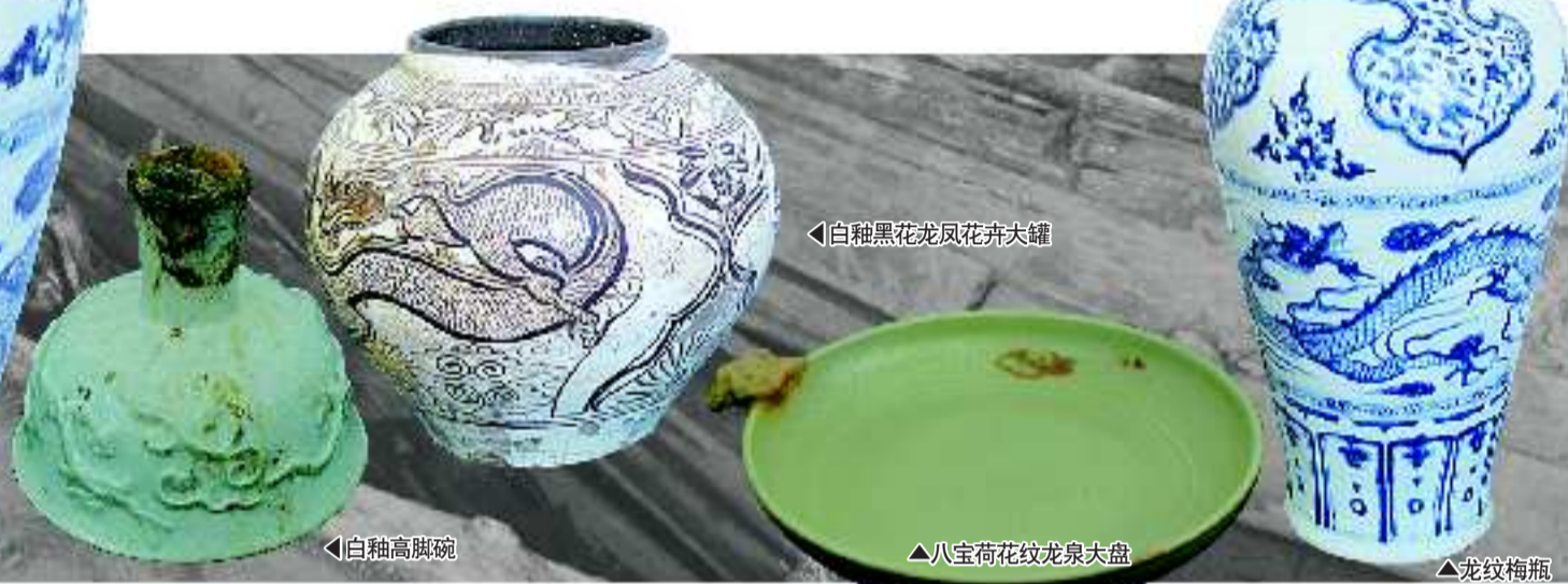
白釉黑花龙凤花卉大罐