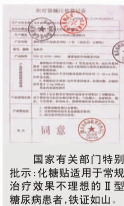
国家有关部门特别批示：化糖贴适用于常规治疗效果不理想的II型糖尿病患者，铁证如山。