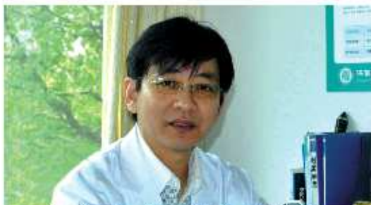
肛肠科副主任医师,中国医科大学二附院分院院长,全国肛肠学会理事,中国保健科技老年医学学会副理事长。