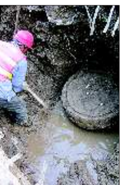
施工人员正在挖掘古经幢。

经幢,指刻有经文之多角形石柱,又名石幢。有二层、三层、四层、六层之分,四角、六角或八角形。其中,以八角形为最多。幢身立于三层基坛之上,隔以莲华座、天盖等,下层柱身刻经文,上层柱身镌题额或愿文。基坛及天盖各有天人、狮子、罗汉等雕刻。多位于一些重要寺庙等地。