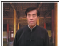
【故宫帝后玉玺】篆刻大师：故宫博物院研究员王玉书先生。