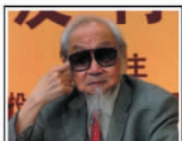
【故宫帝后玉玺】文化总顾问：国学大师、书法家、文学家文怀沙先生。