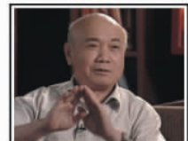
【故宫帝后玉玺】总设计师：故宫博物院原副院长杨新先生。

“世博双玺”是由上海世博会事务协调局授权制造，采用 4 公斤上等和田玉雕琢而成的珍贵级藏品。世博会已圆满闭幕，世博双玺升值在即，我省仅剩少量配额，即日起电话排号预定！ 世博局相关人士分析，迫于和田玉价格的升值压力，收藏者对和田玉【世博双玺】的涨价预期高涨，【世博双玺】发行配额严重紧张，预计世博双玺将进入“白热化”阶段，发行结束后，必将大幅上涨，在此提醒已收藏世博双玺的收藏者在转手时注意关注。