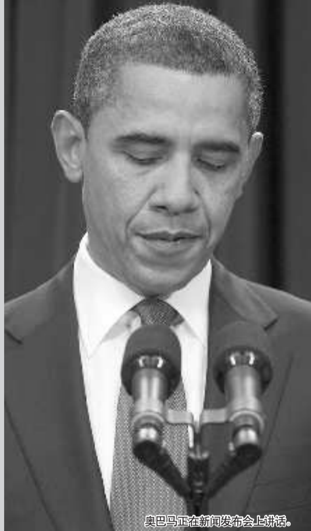
奥巴马正在新闻发布会上讲话。