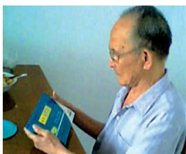
了高科技生物制剂“国科活心活”,五步一体科学疗法让

长期以来,心脏病病人有两大苦恼:一是长年吃药之苦,药越吃越多,病越来越重;二是手术支架搭桥费用高、风险大。北京一位78岁离休老干部患冠心病18年,天天吃药,还做了冠脉支架手术,钱也花了,罪也受了,但术后两年再次发病。服用