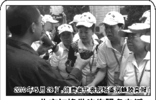
2010年5月28日,消费者代表现场鉴别蜂胶真假!

病人提供高品质蜂胶,解除并发症痛苦做出巨大贡献的肯定!如果不是真蜂胶,能受邀参加世博会吗?能获得联合国千年金奖吗?