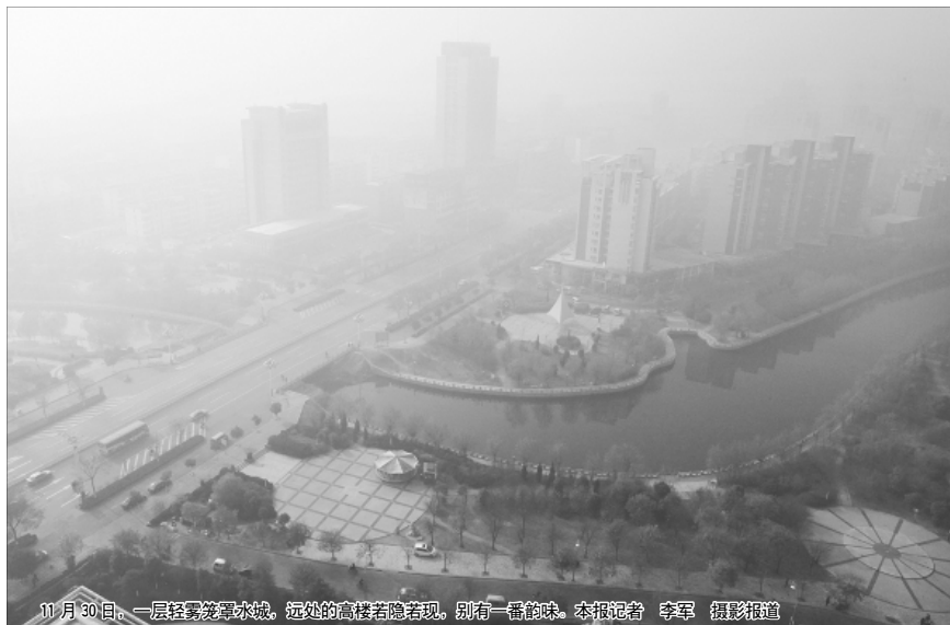
11月30日,一层轻雾笼罩聊城,远处的高楼若隐若现,别有一番韵味。