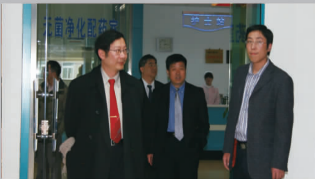
2010年3月，海峡两岸男科学高峰论坛闭幕后，中国台北男科专家代表团一行来到山东东方男科医院参观、交流工作。