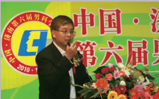
2010年10月，上海仁济医院泌尿外科主任、博士生导师、中华医学学会常务委员戴继灿教授在“中国·济南第六届男科学高峰论坛”上盛赞东方男科技术。