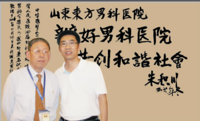
2006年底，中国泌尿男科领军人、北京医科大学人民医院泌尿科主任、博士生导师朱积川教授为山东东方男科医院题词：“办好男科医院，共创和谐社会”。

医院汇集了48位医术精湛，博学多识的全国泰斗级男科专家亲自诊疗，采用独具特色的172种国际前沿新技术以及369套国内顶尖设备，专业专科，专病专治，规范诊疗，以数十万例男科患者的康复病例保障见证了医院从先行者到领导者的成功飞跃。