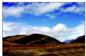
失火前的草原。(资料片)