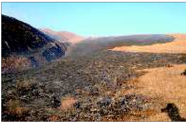
广阔草原被烧成灰。

12月5日12时30分左右,四川甘孜道孚县鲜水镇孜龙村呷乌沟突发草原火灾,22名救火人员在火灾中丧生,1人重伤,遇难者包括15名战士,5名群众,2名林业职工。