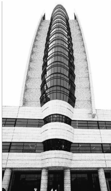
◀建筑局部既似柳叶,又像荷叶。