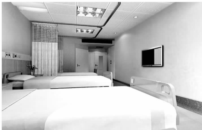
◀病房光线充足、清新舒适。