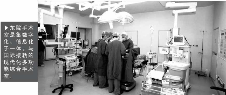
▶东院手术室是集数字化、信息化于一体的,与国际接轨的现代化多功能综合手术室。