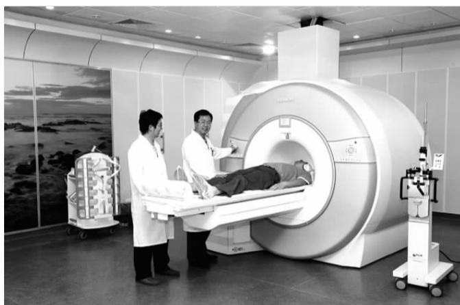
◀东院配备的世界首款大场强磁共振机3.0T MR-Magnetom Verio。