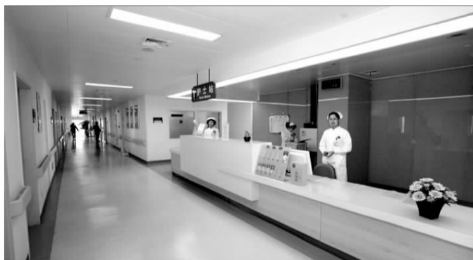
◀人文设计的是护士站,使患者第一时间感受到温暖、便捷的平台。