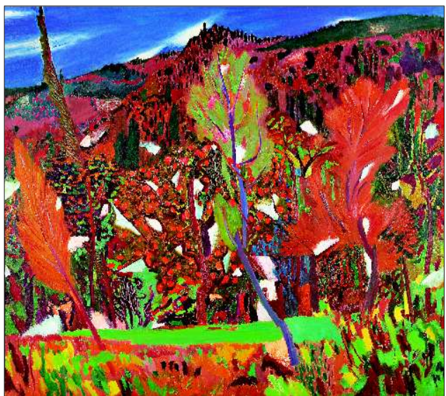
▲深秋的山野 160cm X 180cm 2008

二零一零年十一月末于中央美术学院 (作者系著名艺术家、中央美术学院学术委员会副主任)