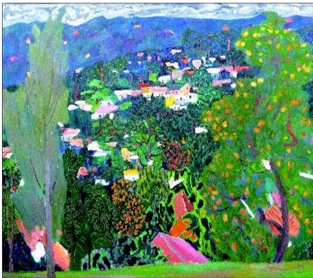
▲峨庄-山谷秋声 160cmX180cm 2008