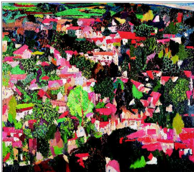
▲秋天的峨庄 180cm X 200cm 2008