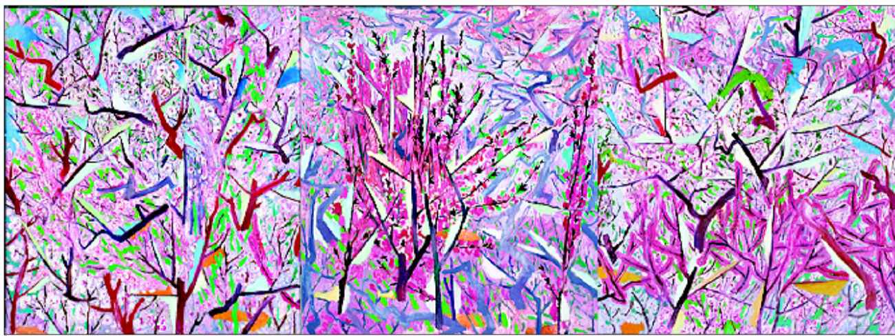
▲桃花开 200X180x3 2008