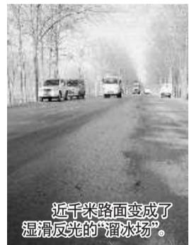
近千米路面变成了湿滑反光的“溜冰场”。