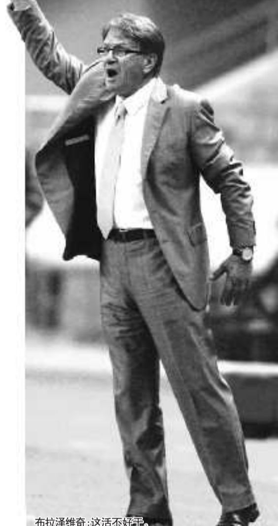
布拉泽维奇:这活不好干。

从在广州亚运会上的表现看,中国国奥队的实力勉强只能算是亚洲二流,要在半年的时间内让这支队伍发生质的变化,几乎是不可能发生的事情。如果布拉泽维奇真的接受这样一份合同,无论是对他还是对中国足球,都是一种莫大的嘲笑。