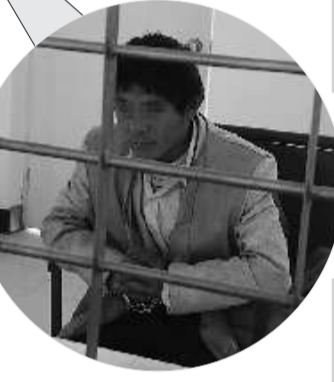
▲唐某接受审讯。

8日,记者在东平县看守所见到了嫌疑人唐某。 记者:为什么要记下销赃日记? 唐某:我傻呗,我脑子好像有毛病,别人也不会干出这种事,说出去别人肯定得笑话我。 记者:你记下这些东西没有害怕吗? 唐某:我本来准备把这些东西转移出来,没想到就栽了。 记者:你如今怎么想? 唐某:都怪我运气不好,被抓前几天我就有预感。 记者:你已经被劳教过4次,为什么屡教不改呢? 唐某:……(撇着嘴不再言语) 本报记者 陈新