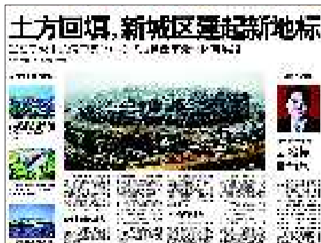
10月29日:济宁奥体中心