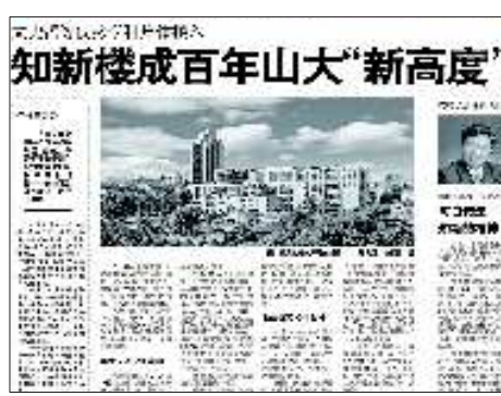
10月27日:山东大学知新楼