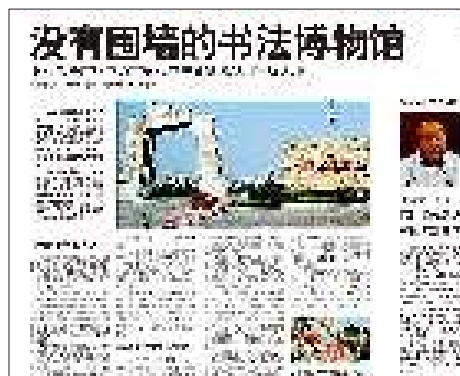
10月21日:临沂书法广场