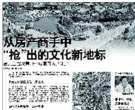
10月11日:台儿庄运河古城