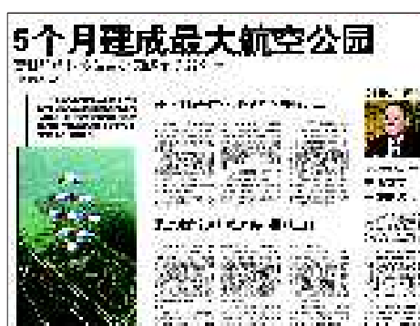
11月9日:莱芜雪野航空科技体育公园