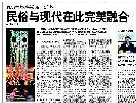
11月2日:潍坊风筝广场