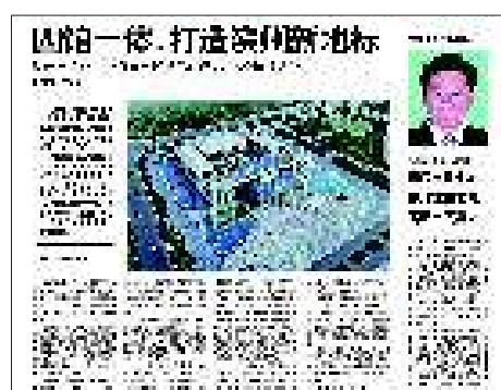
12月3日:滨州市文化中心