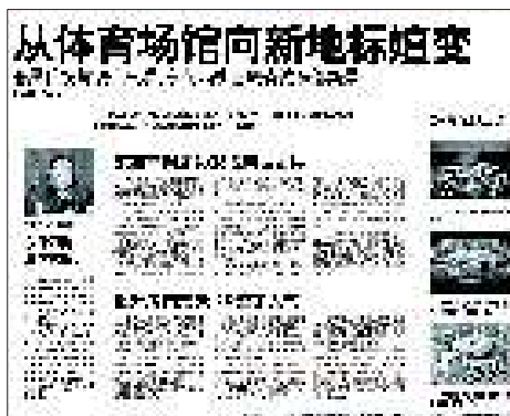
10月15日:济南东荷西柳