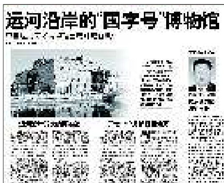
10月19日:聊城运河文化博物馆