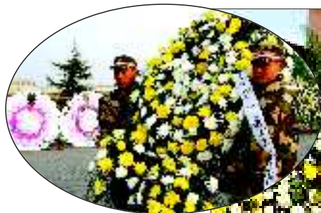
▲今冬刚入伍新兵为烈士敬献花圈。 ▶亲属将烈士骨灰放在仪式现场。