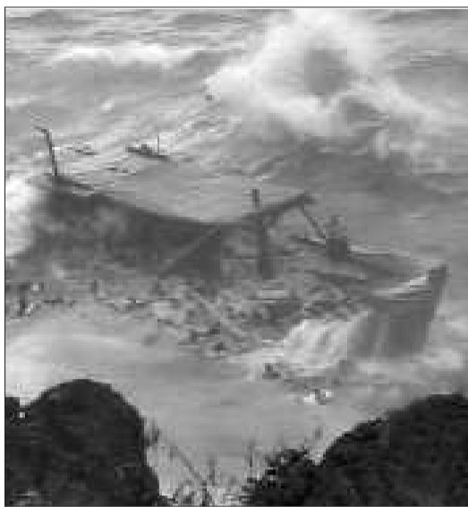
视频截图显示撞崖的偷渡船。

圣诞岛位于印度洋,距澳大利亚本土较远,距印度尼西亚爪哇岛大约300公里,经常被偷渡者选为“落脚点”。