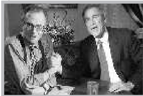
▲拉里·金采访美国前总统布什。

便会出现一位满脸皱纹、戴黑框眼镜、身穿吊带裤的老头,这就是CNN的王牌主播、“拉里·金现场秀”主持人拉里·金。令人遗憾的是,由于节目的收视率和影响力日趋下降,拉里·金于6月29日宣布,他计划今年秋天退休,不再主持这档节目。