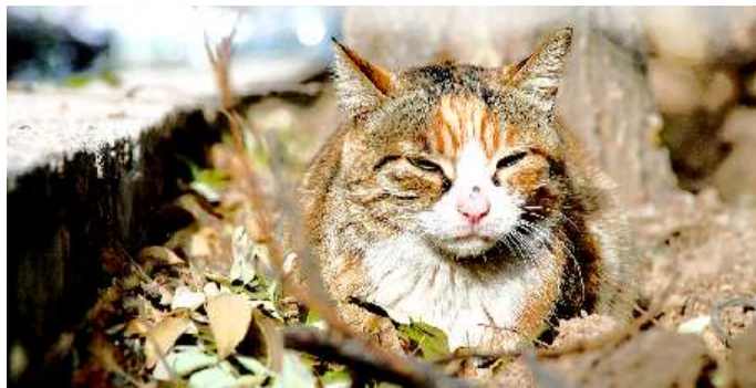
正在校园花坛里休息的一只流浪猫。