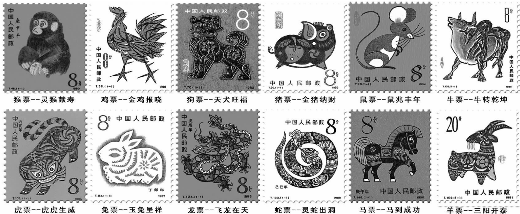
▲ 2011年新年日渐临近,中国集邮总公司,破例将首轮十二生肖邮票铸成12枚“国瓷生肖邮票”,以12个生肖的12个寓意祝福我们在玉兔年里,岁岁平安、年年幸福、人人康泰、事事随心。

罕见魄力!打破30年来只发行单枚纸质生肖邮票的惯例,破例发行第一套《国瓷十二生肖邮票》。