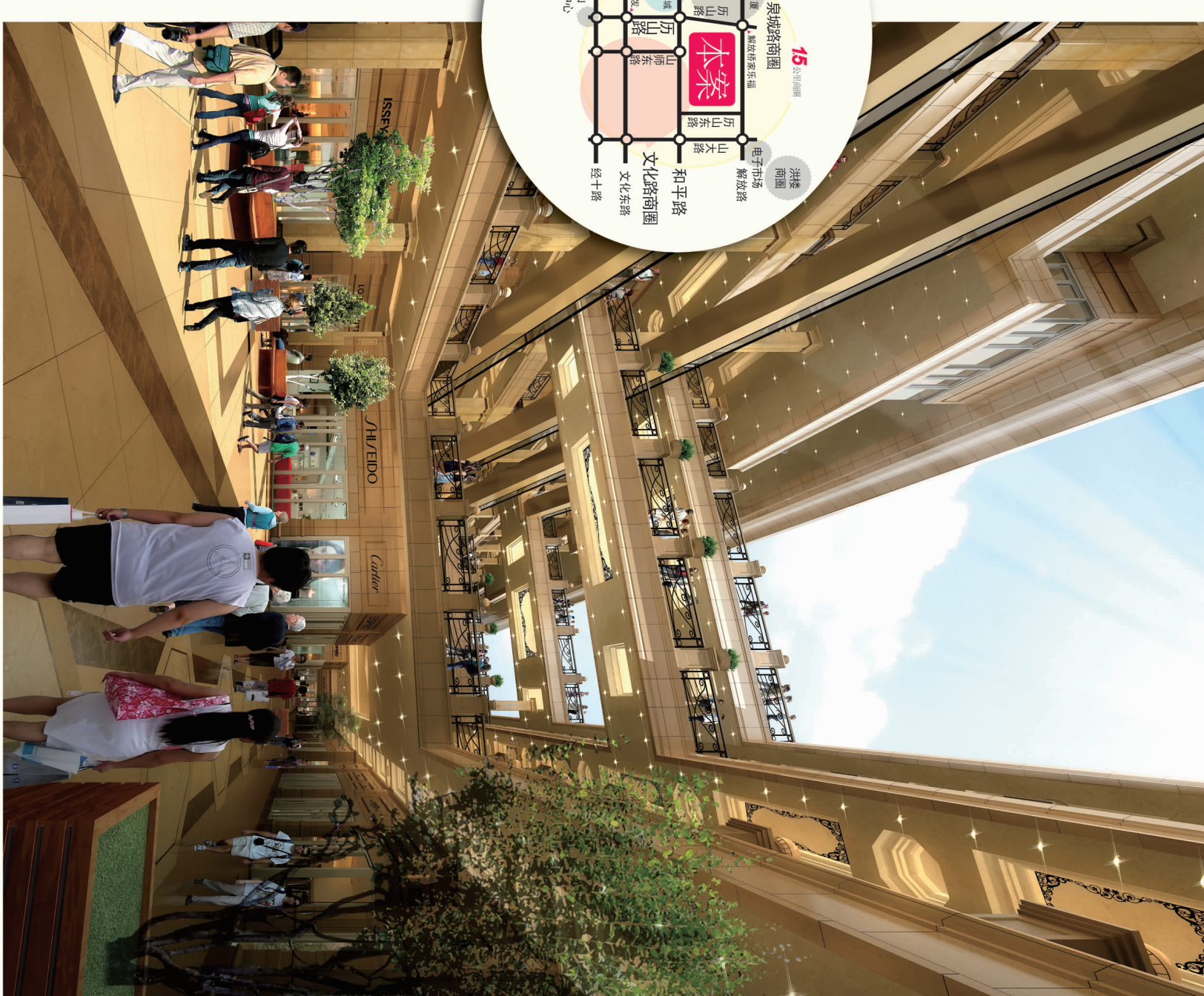
▲ 图片来源: 本资料所涉及的所有内容及图片仅供参考, 均不作为商品房买卖合同条款, 最终以政府文件及商品房买卖合同的约定为准, 最终解释权归山东诚基房地产开发有限公司所有。济建开预许字第(2010)239号