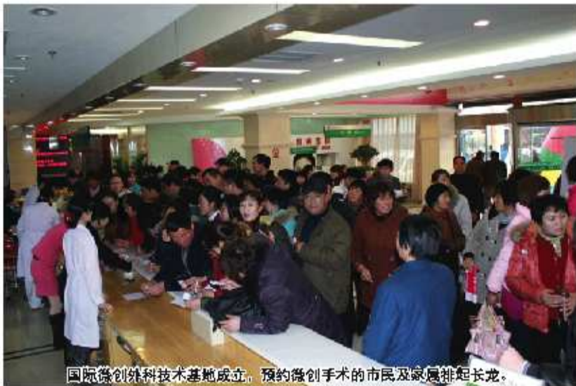
国际微创外科技术基地成立,预约微创手术的市民及家属排起长龙。

乳腺、妇科手术由于伤口大、易引起并发症,患者在治疗中或者治疗后承受的痛苦大。而微创外科技术让现在9成多的乳腺、妇科手术都能“下岗”。微创外科技术利用腹腔镜等,通过病人腹部3毫米的小孔,在可视状态下快速的祛除病灶,术后,一个创可贴就能盖住伤口,恢复快,能够保留子宫和卵巢的正常功能,且不会留下疤痕。