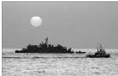
两艘韩国船只在延坪岛附近海域行驶。

士的消息,寻找在朝鲜战争中牺牲及失踪的韩国士兵的遗骸。(综合新华社、《中国日报》)